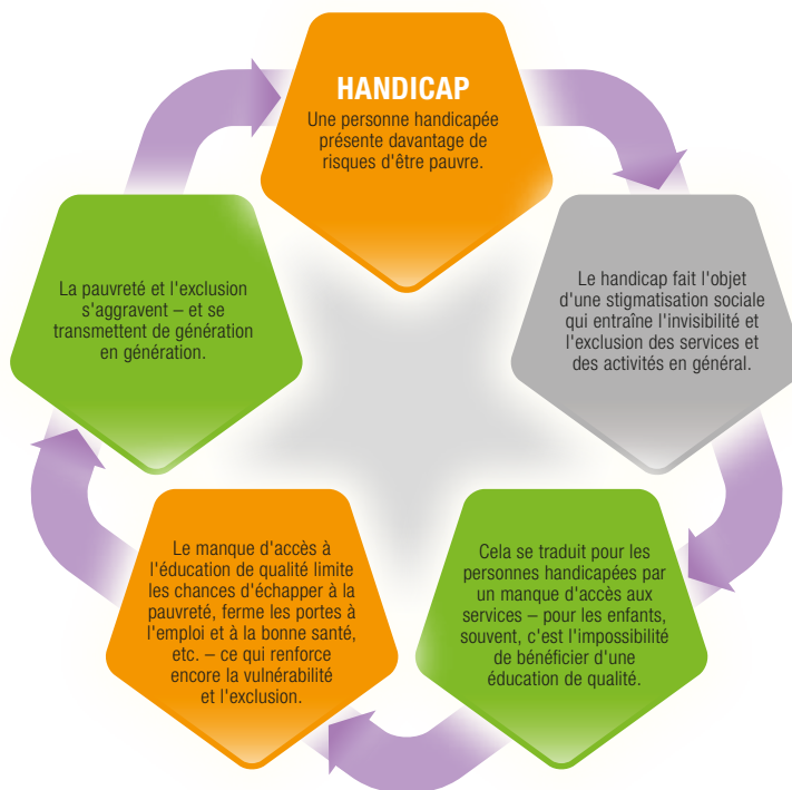
Figure 2. Cycles de pauvreté et d'exclusion

probabilité est plus élevée qu'elles soient « sous-employées », ce qui sous-entend une rémunération moindre, un travail à temps partiel, peu de perspectives à long terme. 36