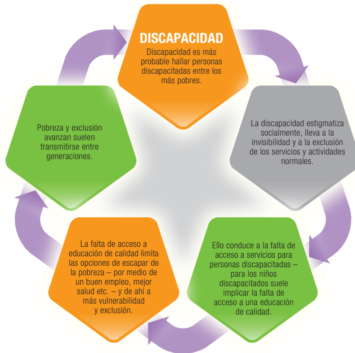
Gráfico 2. Ciclos de pobreza y exclusión

Hay un caudal cierto de evidencia empírica de todo el mundo que indica que las personas discapacitadas son más susceptibles de experimentar desventajas económicas y sociales y que están más en riesgo de pobreza que los que no sufren discapacidad. 35 Por ejemplo, si se comparan las personas no discapacitadas con las personas discapacitadas se observa que las discapacitadas tienen menos posibilidades de tener un empleo a jornada completa, más posibilidades de estar desempleados, y muchas más posibilidades de ser inactivos económicamente. En los países con ingresos bajos y medios, suelen trabajar en la economía sumergida, informal. Cuando trabajan, es probable que estén subempleados, que significa llanamente que probablemente ganan menos dinero, realizan trabajos a tiempo parcial, y tienen menos oportunidades a largo plazo. 36